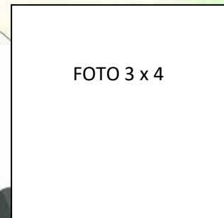
FOTO 3 x 4